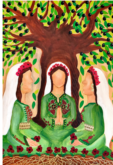
Bild: Titelbild zum WGT 2024 mit dem Titel „Praying Palestinian Women“ von der Künstlerin Halima Aziz, © 2022 World Day of Prayer International Committee

Zu diesem Termin sind Sie, wie jedes Jahr, herzlich eingeladen,